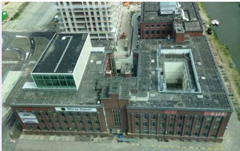
LINKS: LUCHTFOTO GROOT LAB, (LINKS VOLUME MET OPBOUW). RECHTS: 3D IMPRESSIE INBOUW.

Opdrachtgever: Amsterdamse Hogeschool voor de Kunsten Architect: architectenbureau Fritz en MONK Architecten Installaties, Bouwfysica: ABT Constructie: ABT