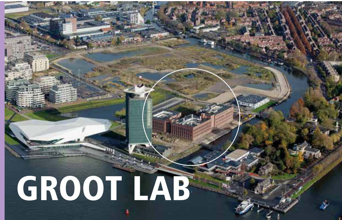
OVERZICHTSFOTO NOORDELIJKE IJ-OEVER IN AMSTERDAM-NOORD MET GROOT LAB, TOREN OVERHOEKS EN FILMMUSEUM EYE.

IN HET GROOT LAB, HET VOORMALIG SHELL-LABORATORIUM AAN DE OEVER VAN HET IJ IN AMSTERDAM-NOORD, ZIJN SINDS KORT TWEE KUNSTOPLEIDINGEN GEHUISVEST: DE BREITNER ACADEMIE EN DAS GRADUATE SCHOOL, BEIDE ONDERDEEL VAN DE AMSTERDAMSE HOGESCHOOL VOOR DE KUNSTEN. ARCHITECTENBUREAU FRITZ, MONK ARCHITECTEN EN ABT HEBBEN INTENSIEF SAMENGEWERKT OM HET GROOT LAB GESCHIKT TE MAKEN VOOR DEZE NIEUWE FUNCTIE. EEN NIEUWE OPBOUW MAAKTE HET MOGELIJK OM THEATERZALEN IN TE PASSEN. HET RESULTAAT? EEN STIJLVOLLE TRANSFORMATIE MET EEN NIEUW HART VOOR HET GEBOUW.