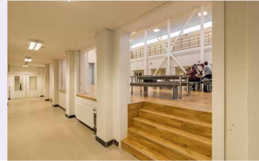
LINKS: OUDE SITUATIE GANG, RECHTS: GANG NA TRANSFORMATIE.

de nieuwe theaterzalen 'los' te staan van het bestaande gebouw. Tezamen met de toepassing van een doos-in-does principe geeft het de gebruikers ultieme vrijheid 1) . De dans- en theaterzalen zijn volledig geluiddicht, waardoor studenten op het vlak van akoestiek geen enkele belemmering ondervinden. Gezien de fysieke raakvlakken tussen de verschillende functies in dit compacte gebouw is dat een mooie prestatie. Dit kon enkel bereikt worden door goede afstemming tussen de bouwkundige detaillering, constructies, installatie en bouwfysica.