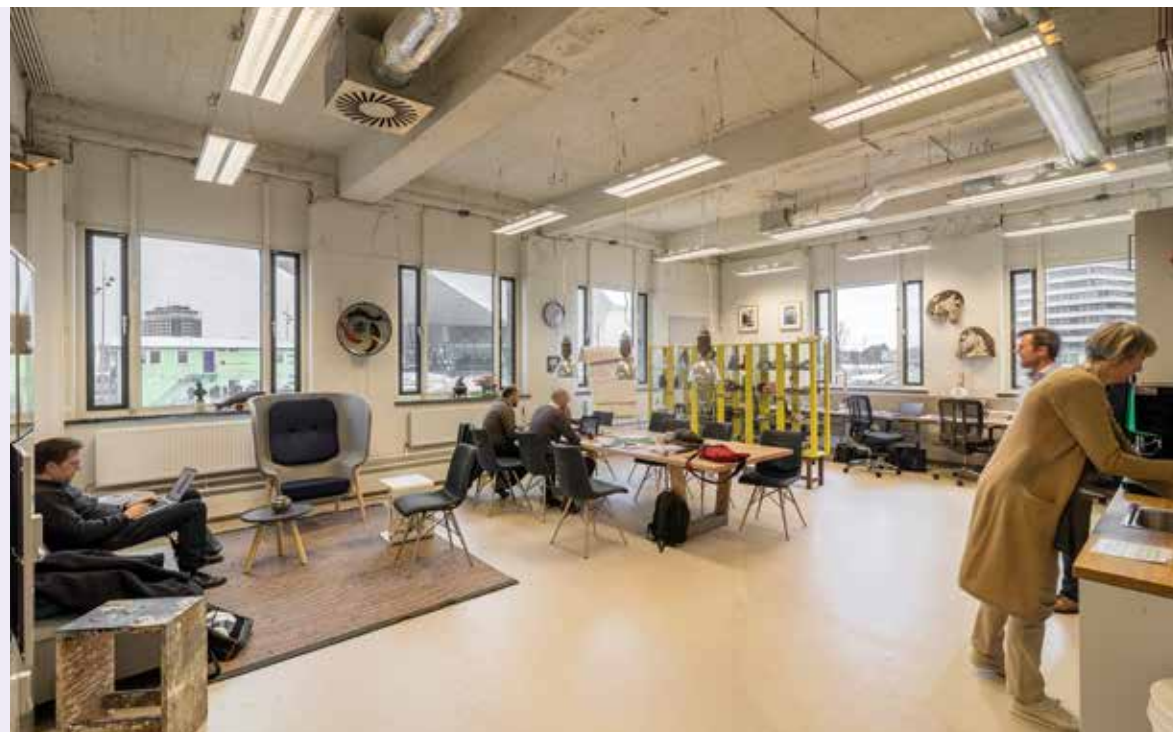
GROOT LAB NA DE TRANSFORMATIE.

Met de uitkomst is de gemeente Amsterdam met marktpartijen gaan praten. Nu, vier jaar later, zijn de drie bouwvolumes van het Groot lab weer gevuld. Het A-lab in blok 2 is een broedplaats voor mediatechniek, blok 3 biedt plaats aan Hostel ClinkNOORD en in 2013 zijn MONK architecten, architectenbureau Fritz en ABT begonnen met de transformering van blok 1 tot onderwijslocatie voor de Amsterdamse School voor de Kunsten.