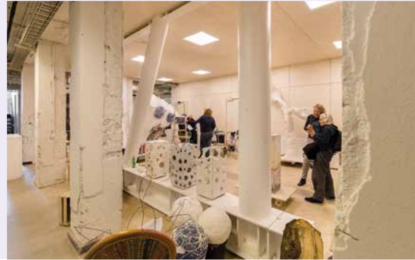
LINKS: KELDER OUD, RECHTS: NIEUW.