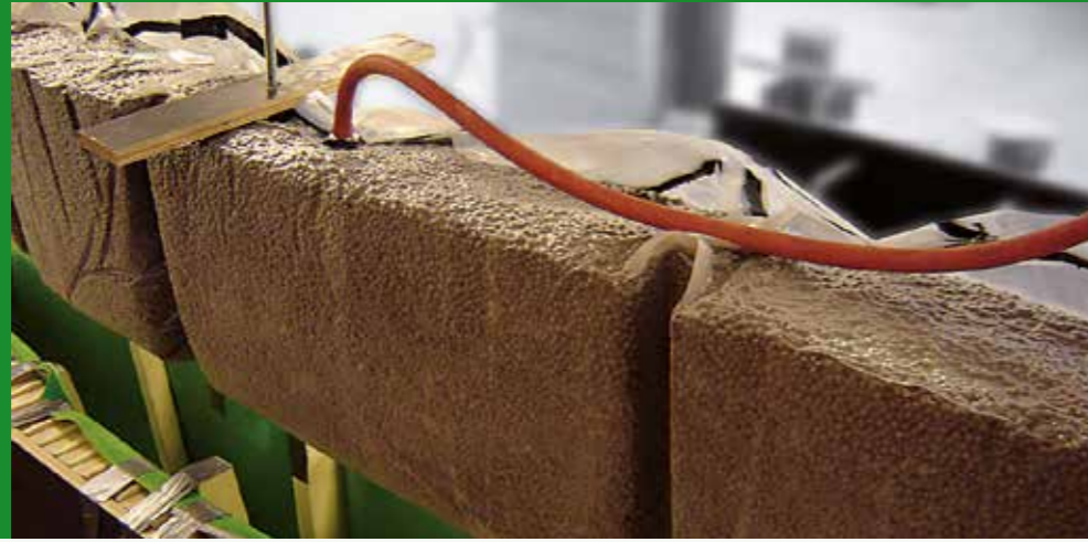
GEREALISEERDE OPPERVLAKTEXTUREN MET VACUUMATICS (ONDER) EN EEN IMPRESSIE VAN EEN VACUÛMCONSTRUCTIE TOEGEPAST ALS BEKISTINGSYSTEEM (LINKS) VOOR DE PRODUCTIE VAN EEN INNOVATIEVE BETONNEN KANO (RECHTS). (GEREALISEERD DOOR STUDIEVERENIGING KOers, TU/e)